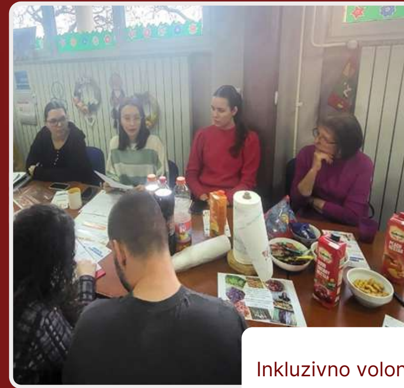
Inkluzivno volontiranje u udruzi OSI SB Loco Moto u suradnji s učenicama Tehničke škole Slavonski Brod