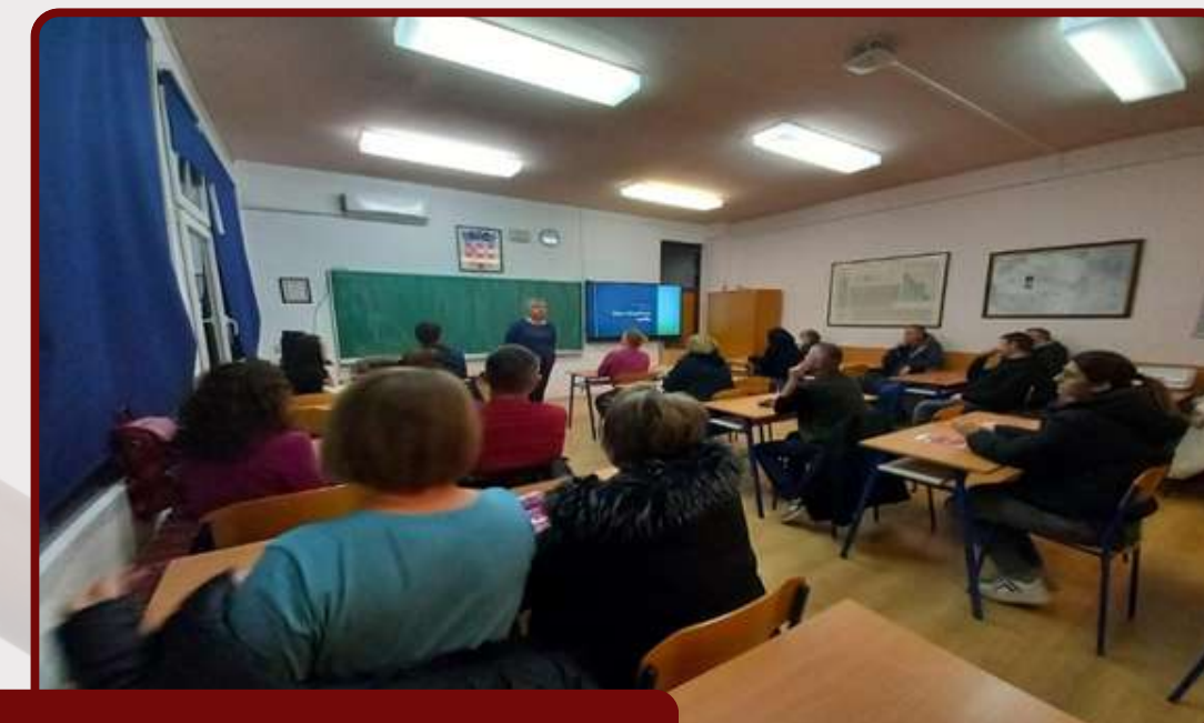
Radionice za nastavnike