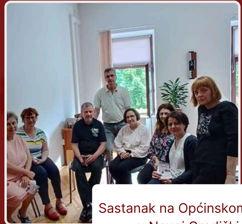
Sastanak na Općinskom sudu u Novoj Gradiški