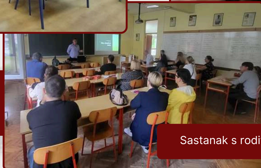
Sastanak s roditeljima