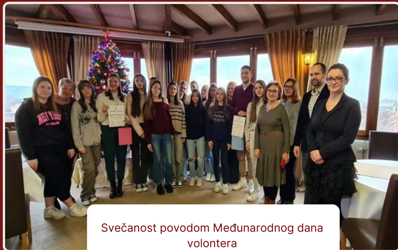
Svečanost povodom Međunarodnog dana volontera