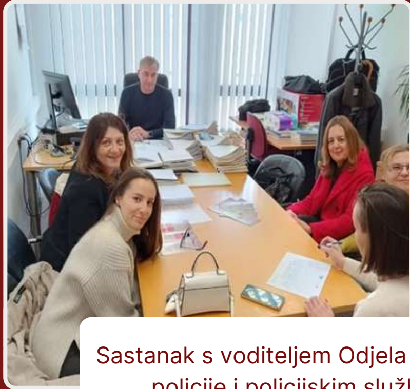
Sastanak s voditeljem Odjela kriminalističke policije i policijskim službenicama Policijske uprave Sisačko-moslavačke