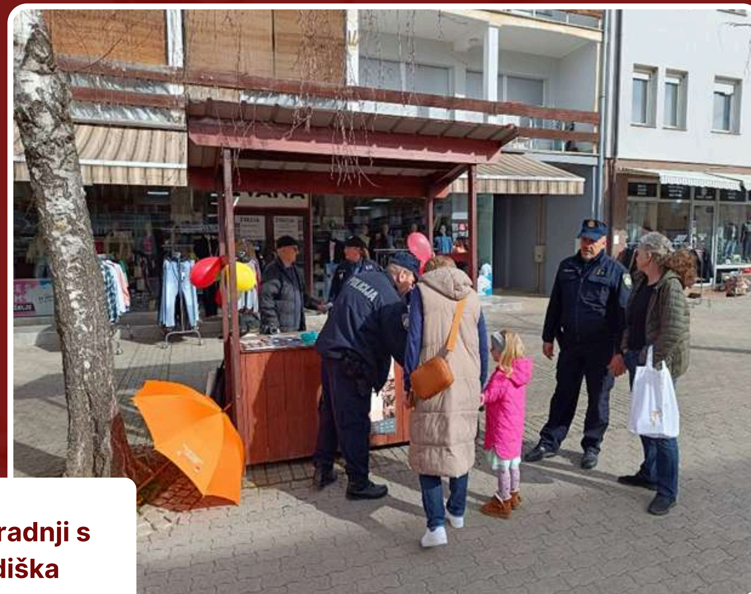
Javna akcija u Novoj Gradiški u suradnji s Policijskom postajom Nova Gradiška povodom Europskog dana žrtava kaznenih djela