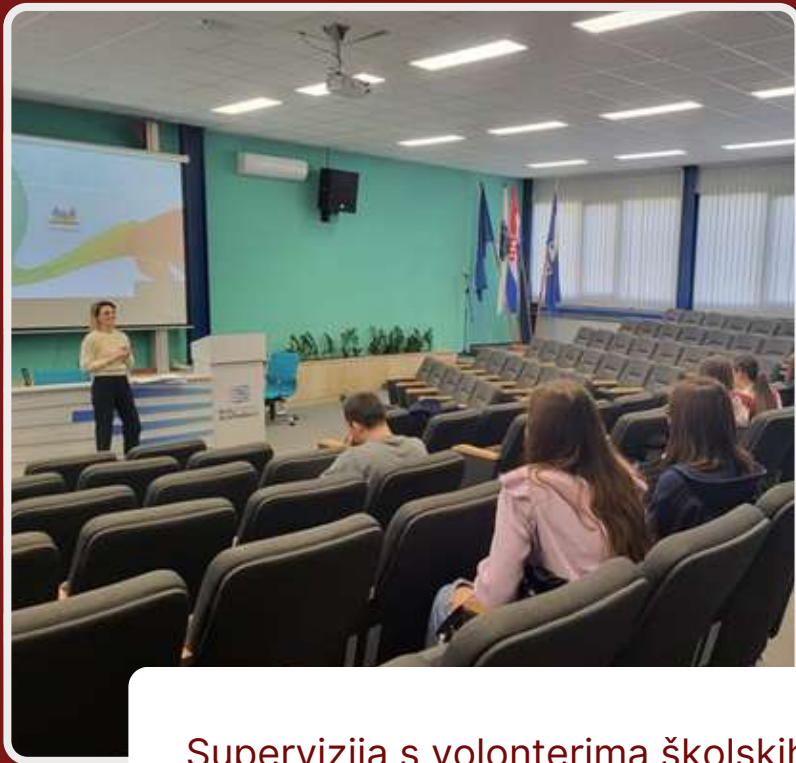
Supervizija s volonterima školskih volonterskih klubova "Plavi mravi" Tehničke škole i „Carpe diem“ Gimnazije „Matija Mesić“ iz Slavenskog Broda te Elektrotehničke i ekonomske škole iz Nove Gradiške