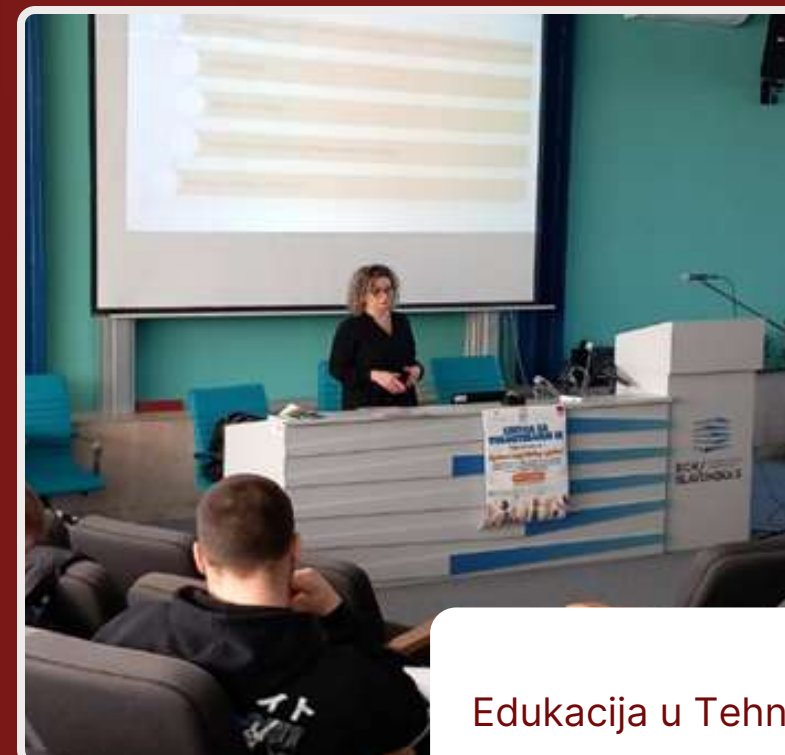
Edukacija u Tehničkoj školi Slavonski Brod