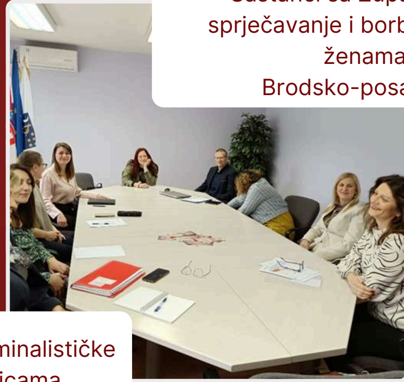
Sastanci sa Županijskim timom za sprječavanje i borbu protiv nasilja nad ženama i obitelji Brodsko-posavske županije