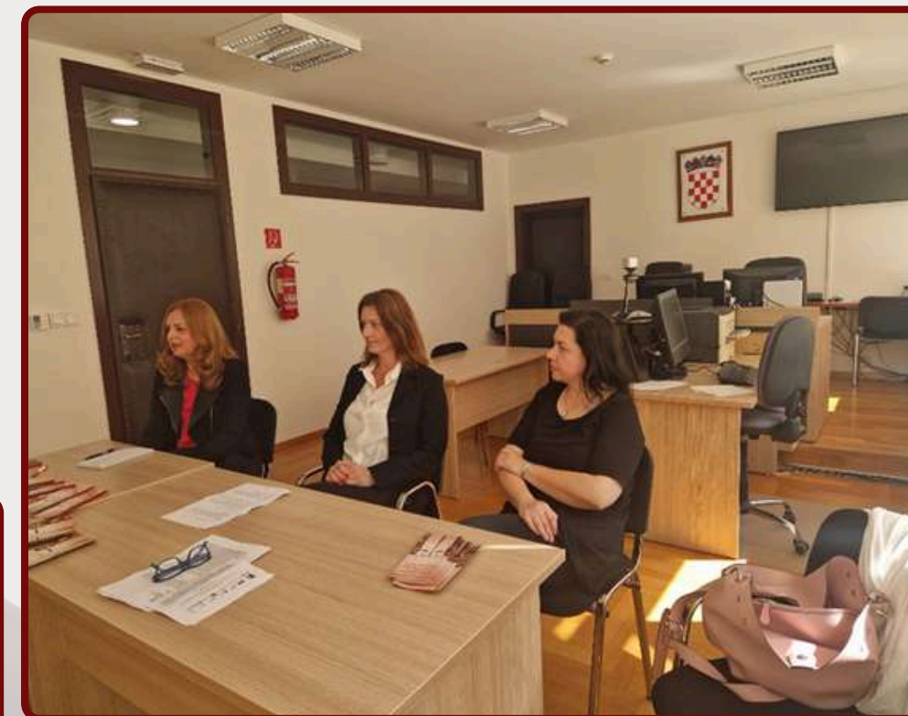
Sastanak sa sucima Općinskog i Županijskog suda u Sisku