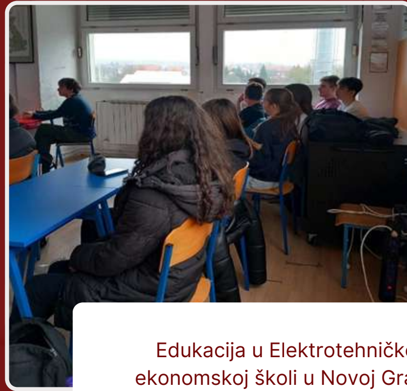
Edukacija u Elektrotehničkoj i ekonomskoj školi u Novoj Gradiški i Gimnaziji „Matija Mesić“ Slavonski Brod