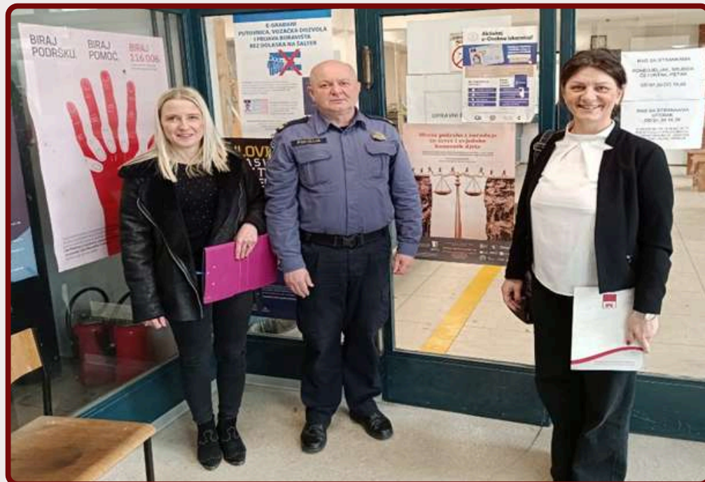
Sastanak sa službenicima Policijske postaje u Petrinji