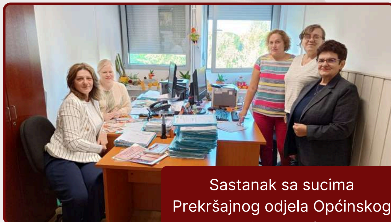
Sastanak sa sucima Prekršajnog odjela Općinskog suda Slavonski Brod