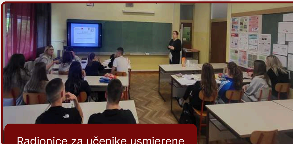
Radionice za učenike usmjerene jačanju vršnjačke podrške protiv nasilja među mladima